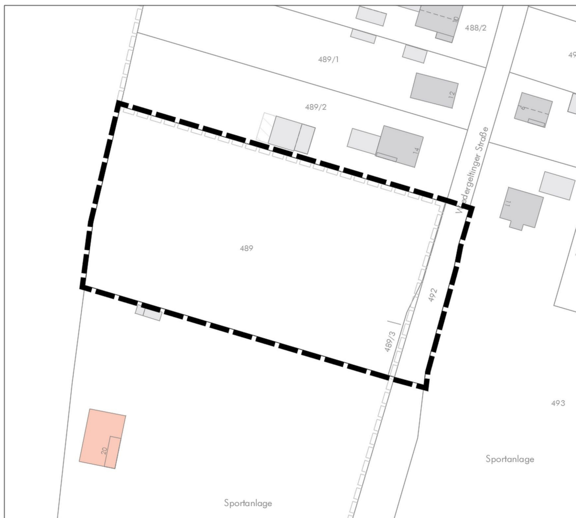
Abbildung 1: Lageplan mit Geltungsbereich, unmaßstäblich

Das Plangebiet befindet sich am südwestlichen Rand von Amberg. Die Grundstücke liegen zwischen dem Sportplatz im Süden und dem schon vorhandenen Wohngebiet von Amberg im Norden. Der Geltungsbereich der Bauleitplanung umfasst die Grundstücke mit den Fl. Nrn. 489, 489/3 und 492, alle Gemarkung Amberg. Er weist eine Größe von ca. 0,65 ha auf.