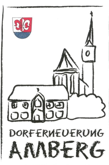
Logo 5 von Ulrich Schechinger

Das Logo sollte auch auf dem Mitteilungsblatt, in welchem es um die Dorferneuerung geht, mit aufgedruckt sein.